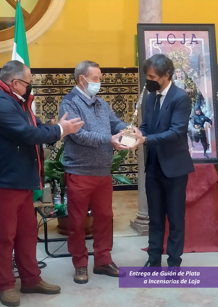
Entrega de Guión de Plata a Incensarios de Loja