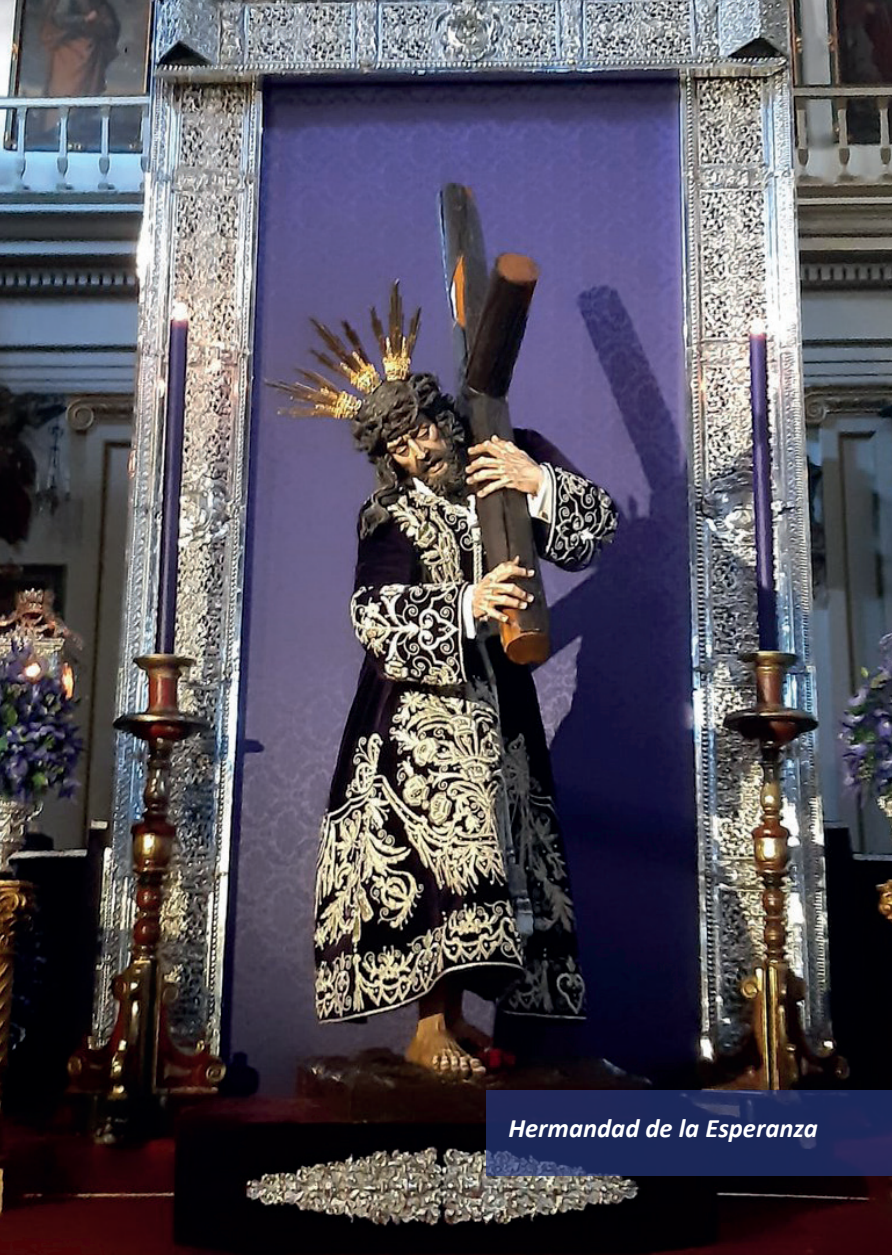
Hermandad de la Esperanza